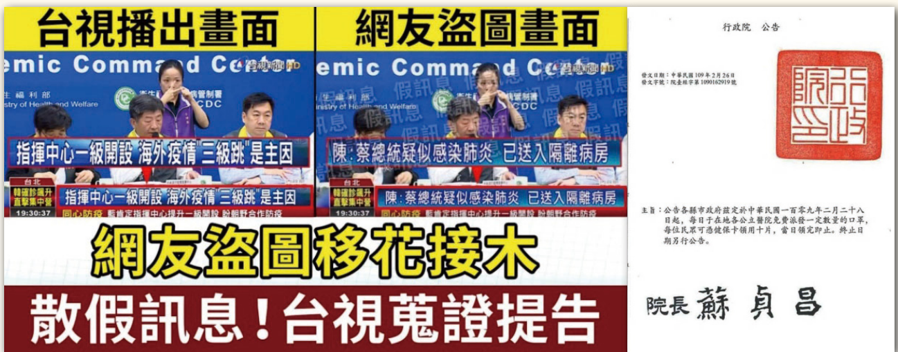
境外勢力運用的假訊息態樣之二：客製化圖文訊息攻擊，右圖為偽造公文。

(二) 客製化圖文訊息攻擊：擷取我國新聞媒體畫面、政府機關公文，假造不實圖文訊息，再搭配我國政府或公眾人物名義散布，增加誤導成效。由於遭偽造之新聞畫面、公文甚有行政院關防及院長簽名章已至足以亂真程度，這類假訊息極易陷民眾於錯誤，讓眾人誤認假訊息內容是客觀事實。