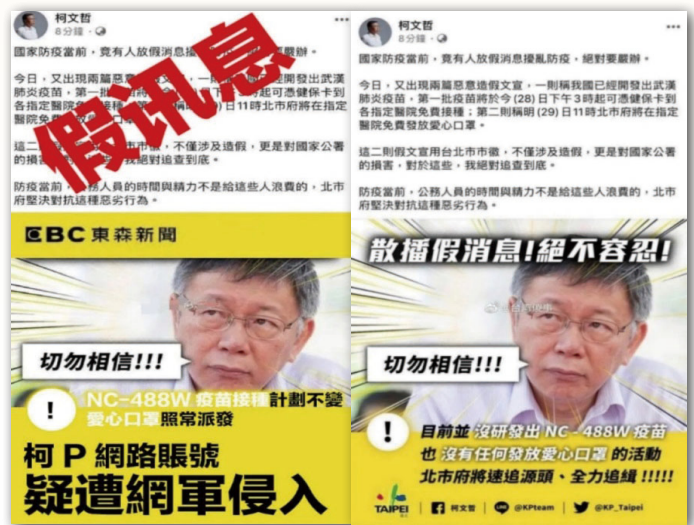
境外勢力運用的假訊息態樣之三：反制澄清抹黑攻擊，左圖為假訊息，右圖為真訊息。

在境外勢力發動前述三波假訊息攻擊的期間，調查局即時應變溯源研判，除了針對以上各種態樣的假訊息進行公開說明，更將其手法揭露予社會大眾知曉，並提出具體預警，供民眾預先防範。